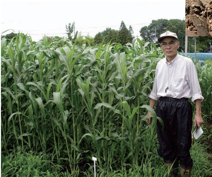
緑肥ソルゴーの生育