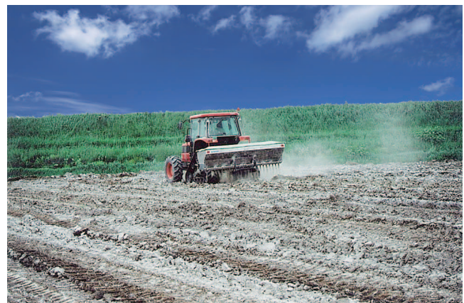
石灰散布