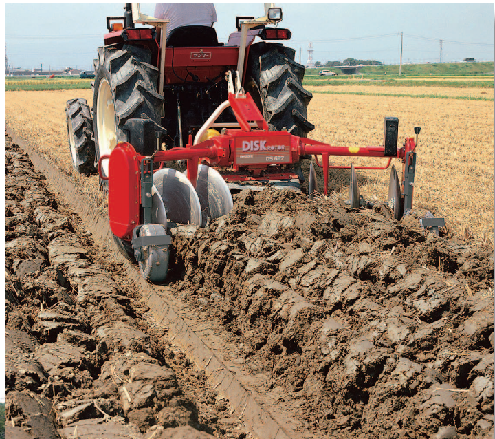
深耕風景