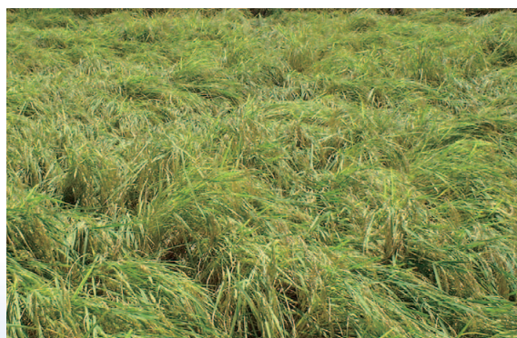
過剰施肥による水稻の倒伏

肥料の施用が過ぎるより、少々不足気味の方が、植物は健全に育ちます。人間と良く似ています。従って、正確な土壌診断に基づいた適切な施肥改善対策が必要です。