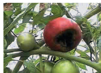
トマトの根腐れ病

すなわち、①石灰の吸収は苦土、カリの多用で抑制する、②苦土の吸収はカリの多用で抑制される、③カリの吸収は石灰、苦土の多用で抑制されるのが一般的です。露地野菜では土壌中の石灰と苦土の比が重量（g）比で 3.7 ～ 7.0、苦土とカリの比が 1.1 ～ 3.2 が適当であると言われています。