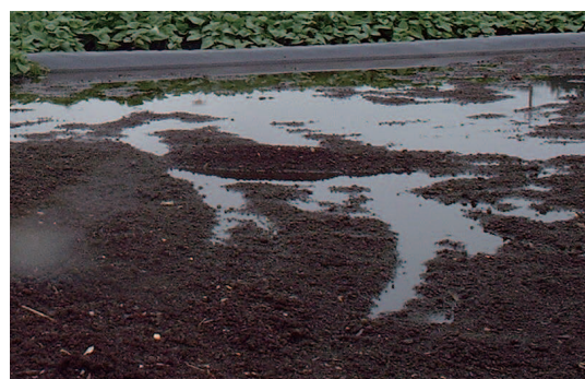
湛水除塩風景（左：施設、下：露地）